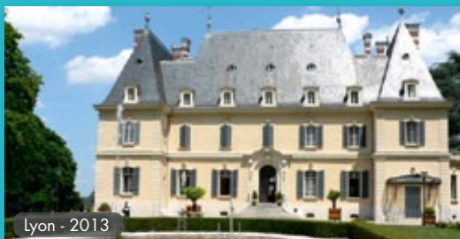
Lyon - 2013