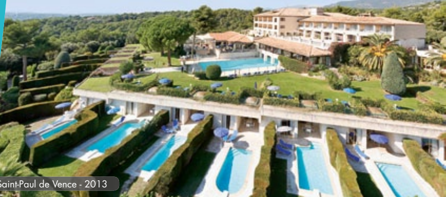
Saint-Paul de Vence - 2013