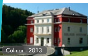
Colmar - 2013