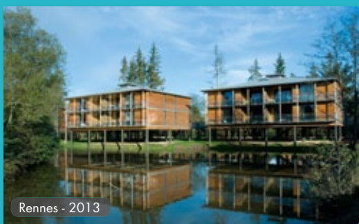
Rennes - 2013