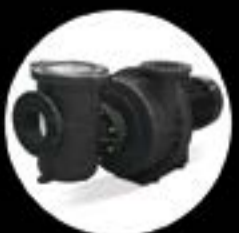
KTVU pump for high flow rates

Our products are found in over 170 countries . We have over 40 years of experience. Over 40,000 professionals and more than 2,000,000 pools use one of our 15,000 products . Completely innovative and sustainable solutions. For all of these reasons and many more, our systems and components for public and private pools are and will continue to be leaders the world over. We set the benchmark for professionals and private home owners. Let AstralPool surprise you once again. And remember: when you see our brand, you are looking at THE POOL BRAND