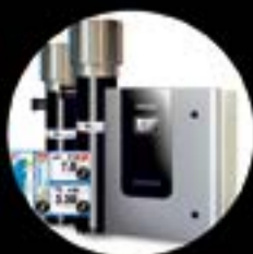
NEOLYSIS DISINFECTION salt electrolysis + UV