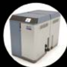
ASTRALPOOL MAC The 3.0 pool