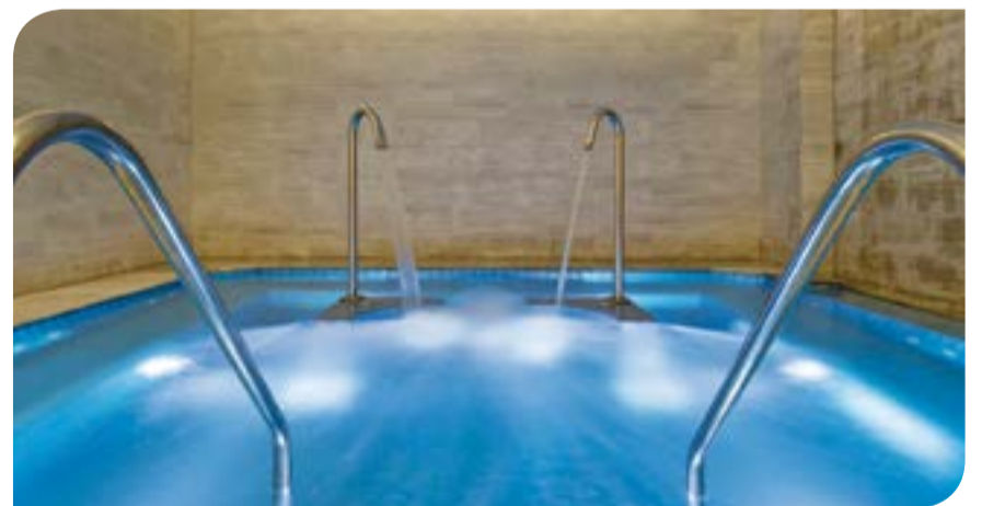
The pool at Westin Resort's Heavenly Spa in Nusa Dua, Bali

يشتمل سبا هيفنلي الفاخر على غرف علاج مائي ودش بخاري، وصالون تصفيف الشعر، وردهة استراحة داخلية، وأماكن الاسترخاء بالماء مع ساونا ملحية، وحمات البخار العطرية والمسابح الحيوية. وعلى أساس خبرتها المكثفة في توفير نظم الأشعة فوق البنفسجية للسبا عالية المستوى، تم اختيار هانوفيا من قبل المقاول الرئيسي، بار+وراى لتوفير نظام تطهير بالأشعة فوق البنفسجية. كما قامت بار+وراى بتركيب معدات لزراع المسبح وأدوات الترفيه داخل المسبح، وكذلك الساونا الملحية، وأحواض البخار العطرية ودش البخار لكبار الرواد. ويتميز نظام هانوفيا بخاصية مسح متأتمت يقوم بتنظيف النظام ومنعه من تكون الرواسب على مصباح الأشعة فوق البنفسجية. تقوم الأشعة فوق البنفسجية بالقضاء على الكائنات الدقيقة في المياه، والسماح بعملية تنظيف بالكور بطريقة محكمة تعمل على تجنب زيادته بكميات ضارة، وتفتت النواتج الثانوية للكور أمين المسبب لتهيج الجلد والنتيجة من عملية المعالجة. وذلك يعمل على التحقق من أن الهواء حول السبا نظيفاً، من دون رائحة الكور الصناعية المرتبطة عادة بالمياه الكلورة بشدة، كما يضمن اهتراء أقل للبنية التركيبية الذي قد ينجم عن النواتج الثانوية غير المرغوب فيها. كما توفر تقنية الأشعة فوق البنفسجية التكلفة على تشغيلها، وذلك بالحد من كمية الكلور المطلوب، مع العمل على أن يتم صرف المياه الناتجة من الغسيل بطريقة صديقة للبيئة.