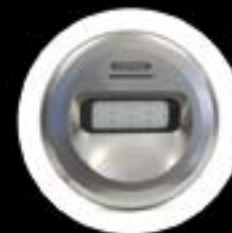
LUMIPLUS design LED lighting