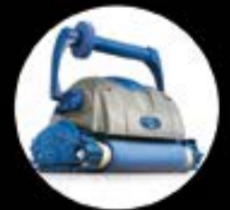
XTREME II Electronic pool cleaner