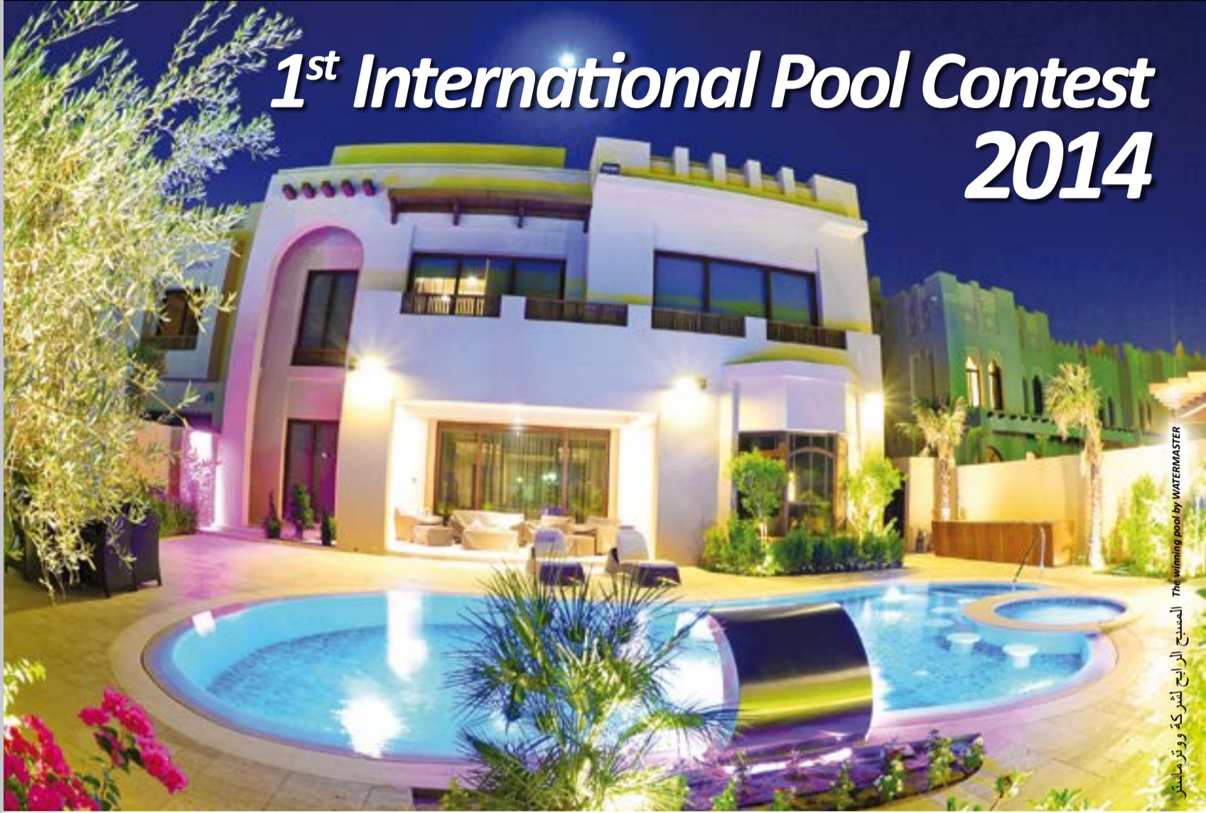
المسبح الرابع لشركة وترماستر The winning pool by WATERMASTER